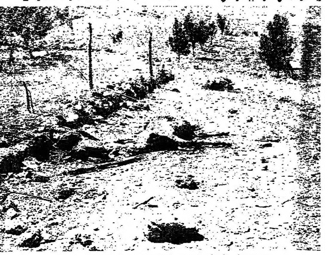
حرائق نجت في الطريق بعد ان اصابها القصف الجوي الإسرائيلي